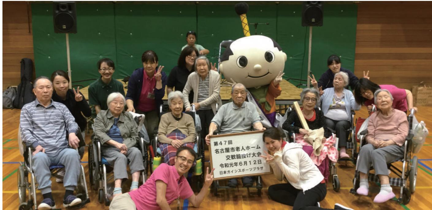
6月12日名古屋市老人福祉施設協議会主催の輪投げ大会に参加し、日頃の練習の成果を披露してきました。